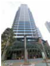
タワーマンション外観