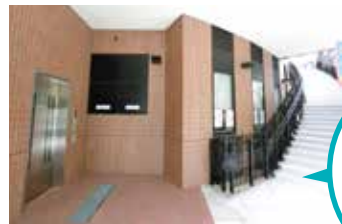
スタジオへの専用エレベーター・階段