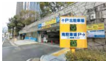
神戸市営三ノ宮駐車場南入り口

2 駐車場南・Dブロックに入って突き当りに出口18番があるので、そこから地上へ。